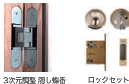
3次元調整 隠し蝶番

4種類からハンドルの選択が可能です。 ※標準以外をご希望の際にはお問い合わせ下さい。