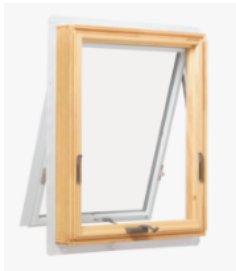
ハンドルを回すと下から上へ 室外側が開閉する窓です