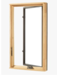
ハンドルを回すと右または左の吊元を軸に 室外側へ開閉する窓です